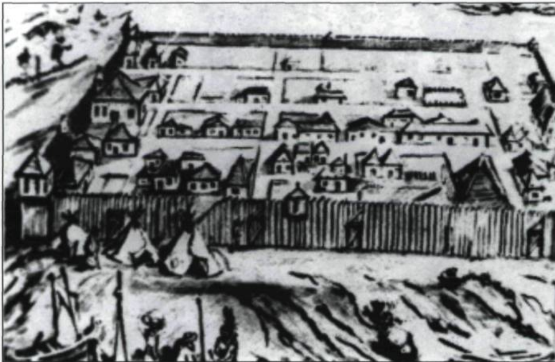
Reconstitution du fort de Pontchartrain, érigé par Lamothe Cadillac.

Pendant une année complète, Cadillac organise sa prise en main personnelle du développement de Détroit. À cette occasion, il bénéficie de l'appui inconditionnel du roi et du ministre. Il demande des hommes de troupe, qu'il entend utiliser à des fins de peuplement en favorisant dans un premier temps leur mariage avant leur départ et leur établissement permanent sur les lieux par la suite. Il veut aussi encourager la migration d'habitants de la colonie en les attirant par le commerce et prédit que par la combinaison de ces stratégies, Détroit deviendra «le Paris de la Nouvelle-France».