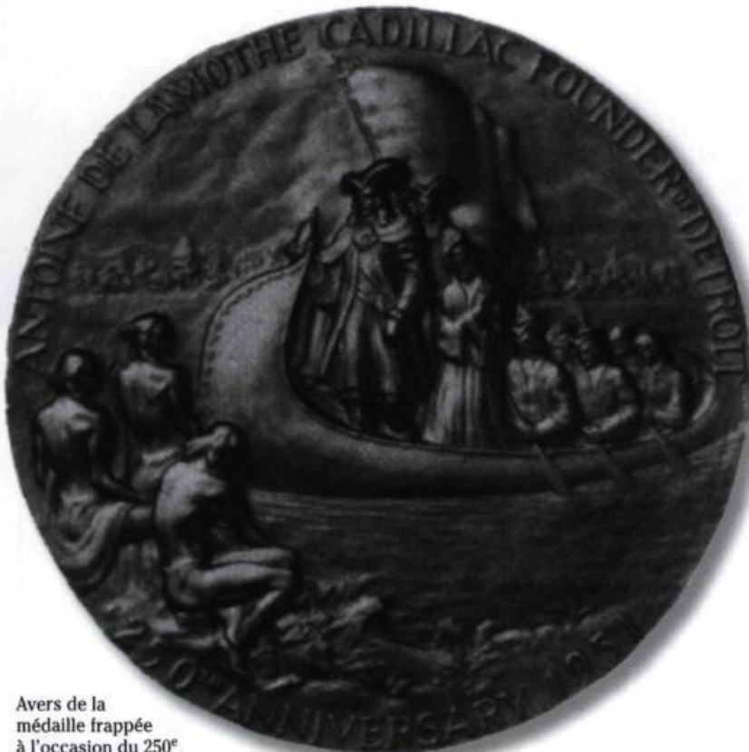
Avers de la médaille frappée à l'occasion du 250 e anniversaire de fondation de Détroit, en 1951. L'illustration montre l'arrivée du fondateur Lamothe Cadillac, en 1701.

A u début du XVIII e siècle, la Nouvelle-France s'étend sur un vaste territoire exploité par une population peu nombreuse. Les politiques gouvernementales du début du siècle tentent de concentrer le peuplement du Canada dans l'aire seigneuriale de la vallée laurentienne, limitant en même temps les concessions de seigneuries et l'établissement de populations à l'ouest de Montréal. Toutefois, les