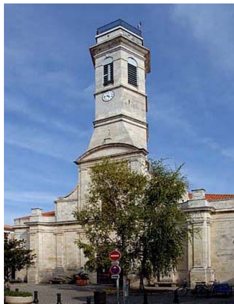
Église de Saint-Pierre d'Oléron.

MIGNON. Sépulture le 2 mai 1749 à Beaumont. Ils auront 13 enfants.