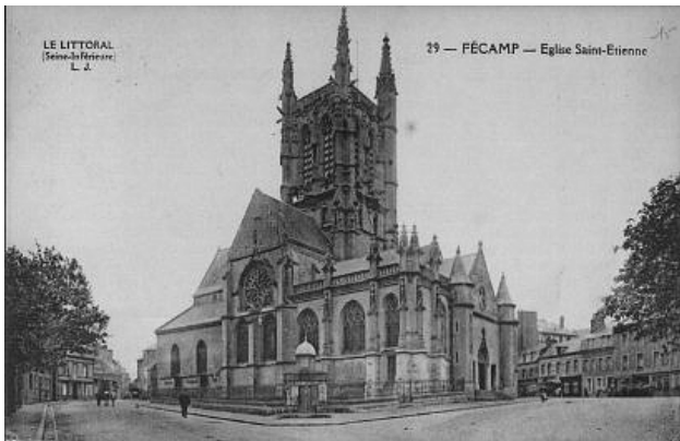
Église de Saint-Étienne de Fécamp.